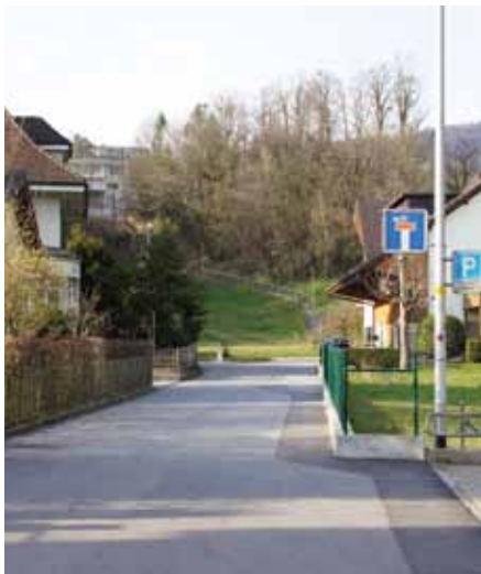
Eigasse, Schulweg: Welches Tempo soll hier gelten?

Die Diskussion um Tempo 30 generell auf den Gemeindestrassen ist in Hägendorf angekommen und wird kontrovers geführt. Der Gemeinderat, eigentlich alleiniger Inhaber der Planungshoheit, hat auf Vorschlag der zuständigen Kommission zum Mitwirkungsverfahren eingeladen. Jetzt geht es darum, die nächsten Schritte zu definieren.