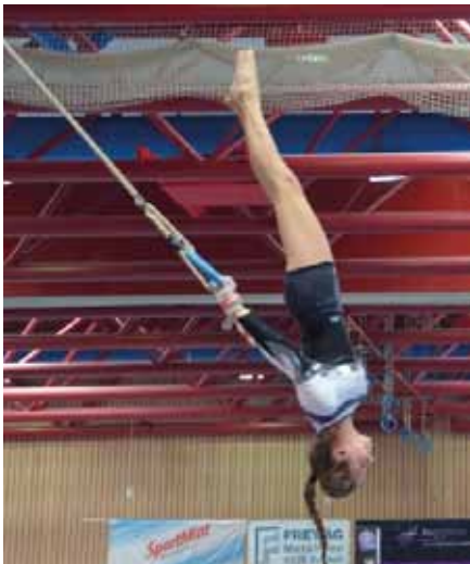
An den Ringen.