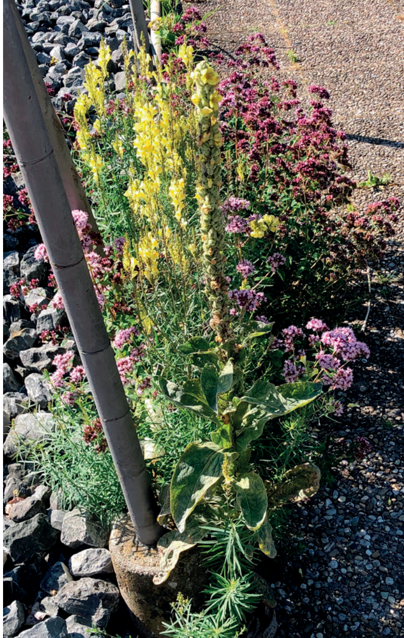
Schotter versus «der Natur den Lauf lassen».