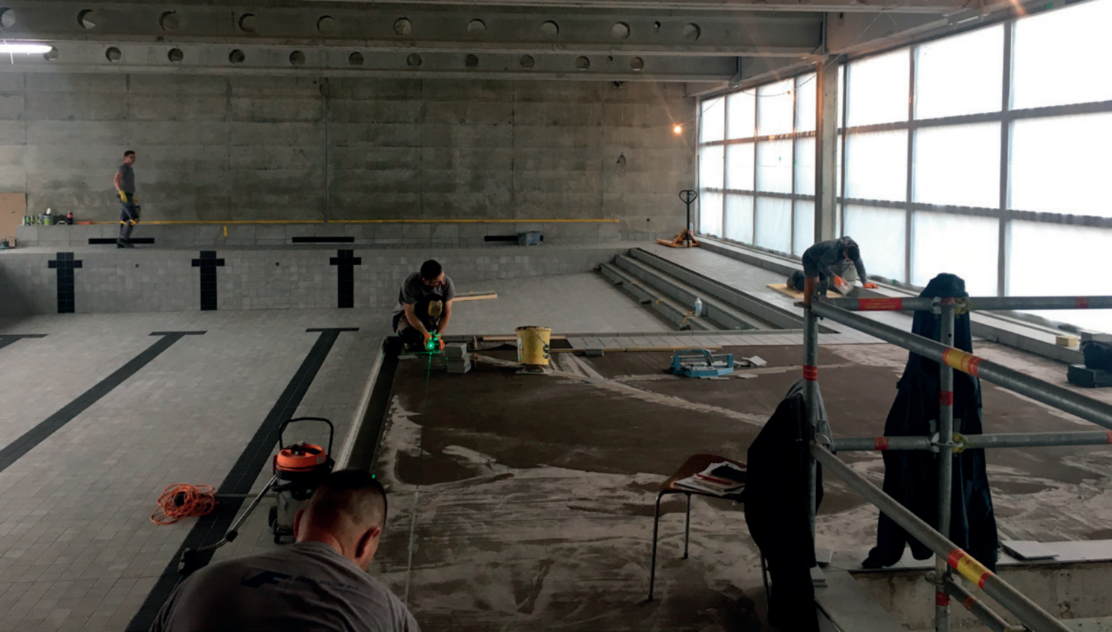
oben: Im Bad werden die Plättli verlegt.